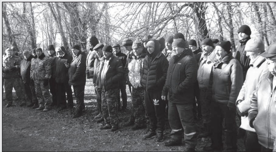
Запуск безпілотника для розвідки. Підбиття підсумків після завершення штурму.